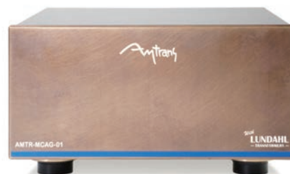
最高級 MC トランス「AMTR-MCAG-01」